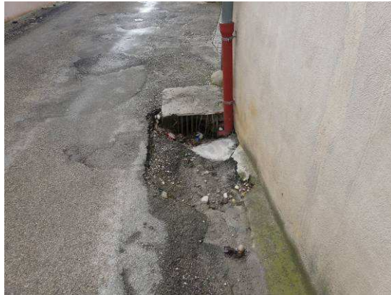
Avaloir ancien, peu ou pas entretenu